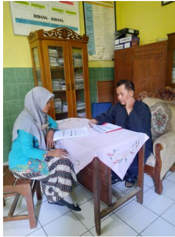
Gambar 4. Kegiatan wawancara (penulis, 2024)

Penjelasan materi menggunakan bahasa yang sederhana namun jelas untuk semua peserta didik,