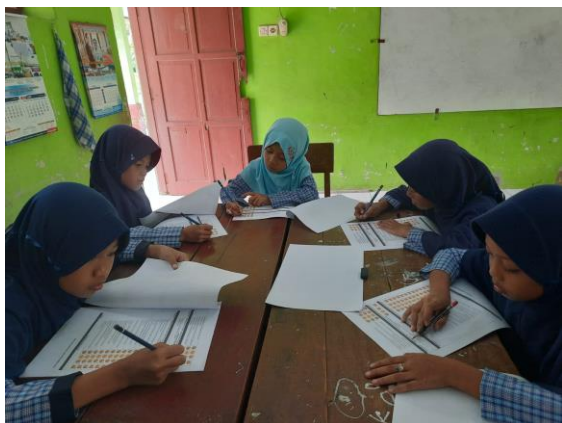
Gambar 2. Kegiatan observasi

Layanan akomodasi dalam cara pengajaran dan materi terkait bimbingan yang diberikan oleh guru selama proses pembelajaran difokuskan pada beberapa aspek yang diteliti, yaitu: (1) memulai pelajaran dengan mengulas atau mengulang materi sebelumnya untuk menghubungkan dengan materi yang akan disampaikan; (2) menyampaikan pembelajaran secara bertahap sesuai dengan kemampuan peserta didik; (3) melakukan pembelajaran dalam kelompok kecil atau heterogen; (4) menggunakan bahasa yang sederhana namun jelas dan perlahan; (5) mengulangi materi secara individual; (6) membimbing dalam membuat kesimpulan; (7) menggunakan media konkret dan media sekitar untuk menjelaskan materi; dan (8) memanfaatkan teknologi sebagai media pembelajaran.