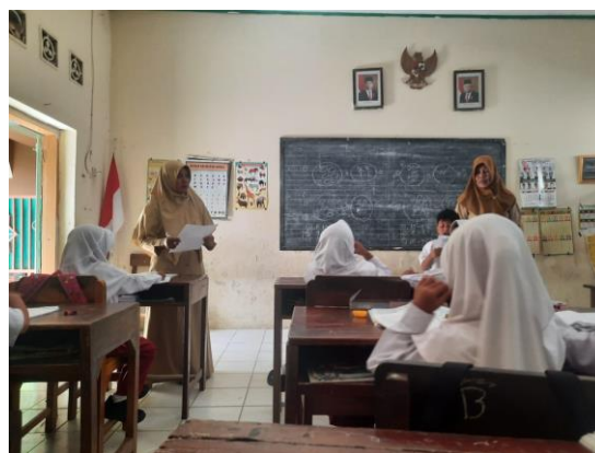
Gambar 3. Kegiatan observasi kelas (penulis, 2024)

Guru memulai pelajaran dengan mengulas atau mengulang materi dengan menjelaskan poin-poin materi dan melakukan sesi tanya jawab terkait materi yang telah disampaikan pada pertemuan sebelumnya. Dari hasil wawancara, guru menyebutkan bahwa pengulangan materi dilakukan dengan tanya jawab mengenai kesulitan dalam mengerjakan pekerjaan rumah yang telah diberikan, kemudian guru menjelaskan ulang materi berupa poin-poin penting. Namun, pengaitan antara materi sebelumnya dengan materi baru tidak dilakukan oleh guru. Ini sejalan dengan pendapat Desiningrum (2016) yang menyatakan bahwa pengajaran materi baru sebaiknya dilakukan dengan mengaitkan materi tersebut dengan yang telah dipahami sebelumnya agar lebih mudah dipahami oleh peserta didik slow learner.